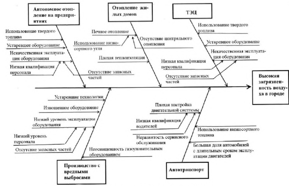
Рис. 5. Пример структурирования проблемы методом Исикавы